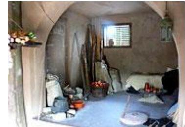
Einraumhaus zur Zeit Jesu

Wer schon mal virtuell hinreisen möchte: www.bibeldorf.de