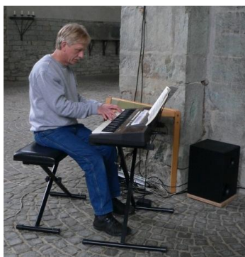
Das bisherige Keyboard