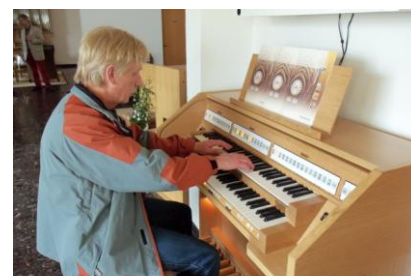
So könnte die neue Orgel aussehen

*Digitale Orgel = Orgel, bei der Ton für Ton, Register für Register einer originalen Pfeifenorgel aufgezeichnet und im Labor gesampelt wurde. Im Unterschied zu einer echten Orgel sind digitale Orgeln den Witterungsbedingungen im Langschiff wartungsfrei gewachsen und vor allem wesentlich (!) günstiger. Der Kostenrahmen bei den von uns bevorzugten Modellen beläuft sich auf 11.000-13.000 Euro.