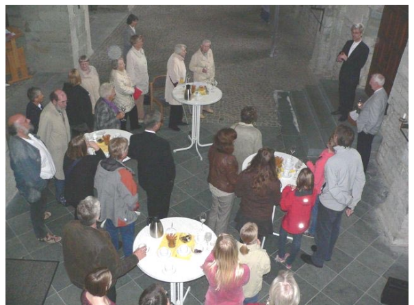
Danksagung beim Empfang zur Verabschiedung am 17. Mai

Der Sitz im Presbyterium ist nun vakant geworden. Erst im Frühjahr 2012 würde durch turnusgemäße Neuwahl das Presbyterium wieder neu zusammengesetzt und vervollständigt. So lange möchten wir aber nicht gerne warten. Das Kirchenrecht bietet für diesen Fall die Möglichkeit einer Auffüllung des Presbyteriums durch „Kooptierung“, d.h. das Presbyterium kann eine/n Nachfolger/in berufen und der Gemeinde den Beschluss in geeigneter Weise bekanntgeben. Falls nach einer Frist dann kein Einspruch erfolgt, wird die Berufung zur Presbyter/in gültig.